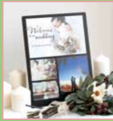
ウェルカムボード