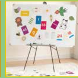
子供のお絵かきや学習教材など