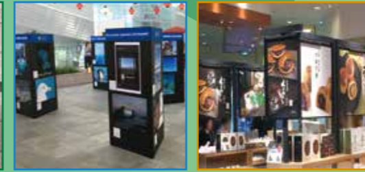
羽田空港催事場(期間限定)